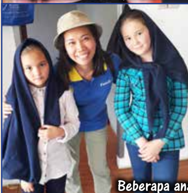
Beberapa anak pengungsi