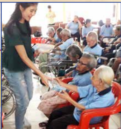
Membagikan kotak makan siang