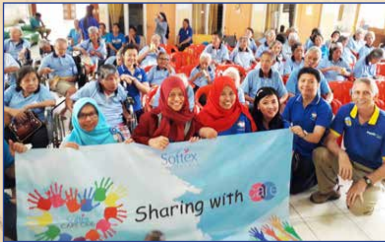
Relawan dari PT. Softex dan CAMADE bersama oma dan opa

Bersama-sama, relawan dari CAMADE dan PT. Softex Indonesia mengunjungi Panti Jompo di Tangerang . Kami menikmati waktu berbincang-bincang, bernyanyi dan makan siang bersama oma dan opa. Terima kasih kepada PT. Softex Indonesia yang telah menyediakan makan siang dan mendo nasikan popok dewasa dan pembalut wanita.