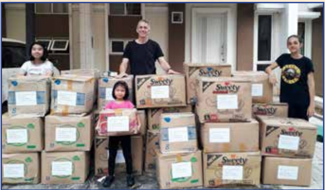
Kardus-kardus berisi barang sumbangan siap dikirim

Bulan ini kami mengirim 34 kardus berisi barang sumbangan ke Atambua untuk program kami di bulan Agustus. Terima kasih PT. Softex yang mensupport kami lewat popok bayi dan pembalut wanita. Selain itu, teman-teman lain juga turut membantu dengan menyumbang baju-baju.