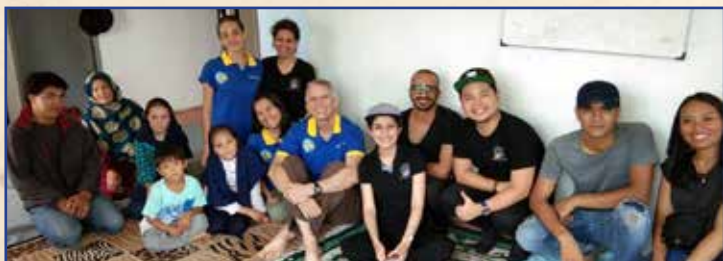
Mengunjungi salah satu keluarga pengungsi

Sekali lagi relawan CAMADE bekerja bersama RAIC ( Refugee Asylum Seekers Information Center ) mengunjungi tempat para pengungsi di daerah Cisarua, Puncak dan kemudian di lain hari di daerah Pasar Minggu (para pengungsi ini datang dari Timur Tengah dan Africa). Terima kasih kepada para sponsor yang telah mendonasikan sebanyak 110 paket bahan sembako untuk para pengungsi.