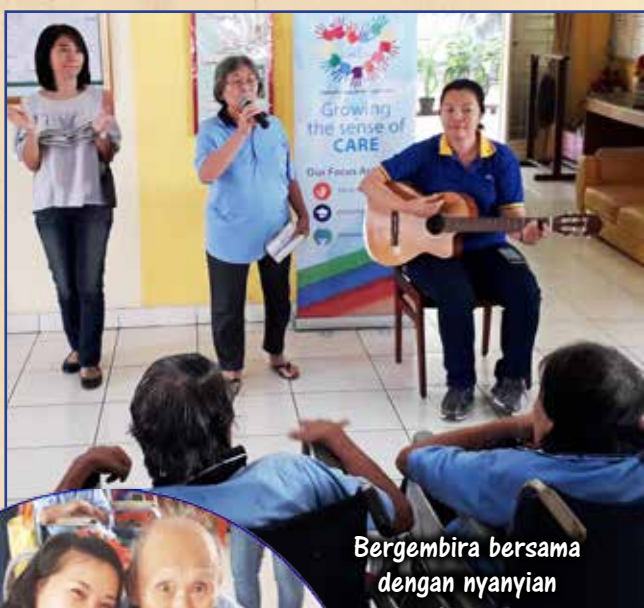
Bergembira bersama dengan nyanyian