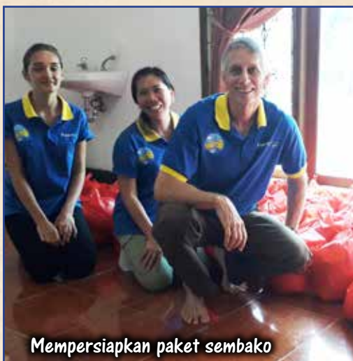
Mempersiapkan paket sembako