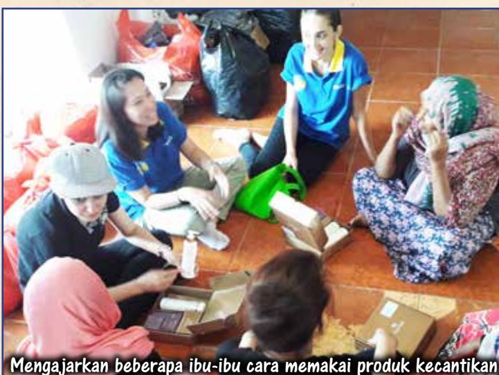
Mengajarkan beberapa ibu-ibu cara memakai produk kecantikan