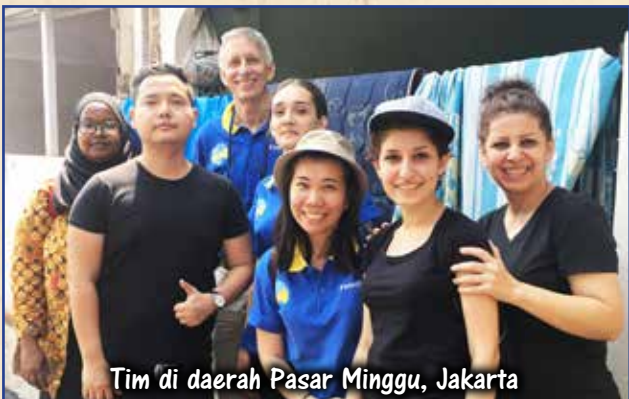
Tim di daerah Pasar Minggu, Jakarta