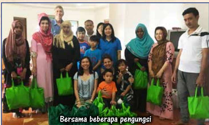
Bersama beberapa pengungsi