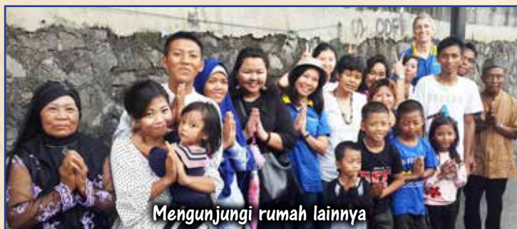
Mengunjungi rumah lainnya

Setiap tahun di Hari Raya Idul Fitri kami bersilaturahmi ke rumah mantan anak-anak jalanan yang disekolahkan oleh Yayasan Sahabat Anak . Yayasan ini membantu para anak-anak untuk berhenti berkeliaran di jalanan dan kembali ke Sekolah. Anak-anak dan keluarga mereka tinggal di daerah kumuh di area Jakarta . Tahun ini kami kembali mengadakan silaturahmi dari rumah ke rumah. Mereka tidak suka dengan panggilan “anak-anak jalanan”, alasan mereka pun sangat jelas, karena mereka sudah tidak lagi berkeliaran di jalan tetapi sudah bersekolah. Beberapa dari anak-anak ini mempunyai kisah yang menyentuh hati dan menginspirasi.