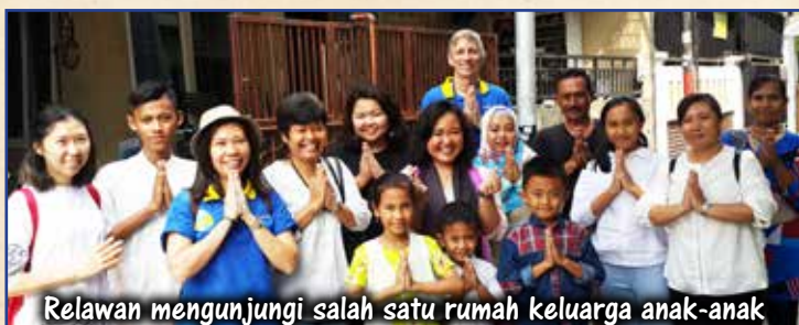
Relawan mengunjungi salah satu rumah keluarga anak-anak

Setiap tahun di Hari Raya Idul Fitri kami bersilaturahmi ke rumah mantan anak-anak jalanan yang disekolahkan oleh Yayasan Sahabat Anak . Yayasan ini membantu para anak-anak untuk berhenti berkeliaran di jalanan dan kembali ke Sekolah. Anak-anak dan keluarga mereka tinggal di daerah kumuh di area Jakarta . Tahun ini kami kembali mengadakan silaturahmi dari rumah ke rumah. Mereka tidak suka dengan panggilan “anak-anak jalanan”, alasan mereka pun sangat jelas, karena mereka sudah tidak lagi berkeliaran di jalan tetapi sudah bersekolah. Beberapa dari anak-anak ini mempunyai kisah yang menyentuh hati dan menginspirasi.