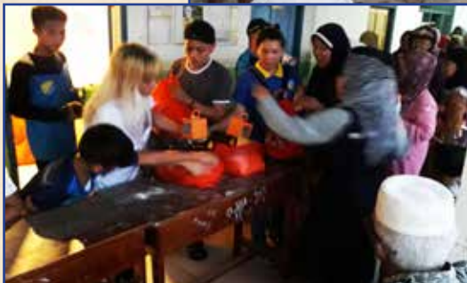
kiri Acara pem- bagian