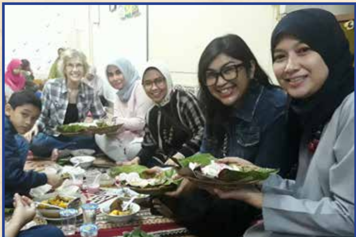
Buka puasa bersama para dokter

Bersama-sama kita bisa membawa perubahan!