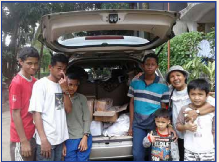
Mengantarkan bahan sembako ke Panti