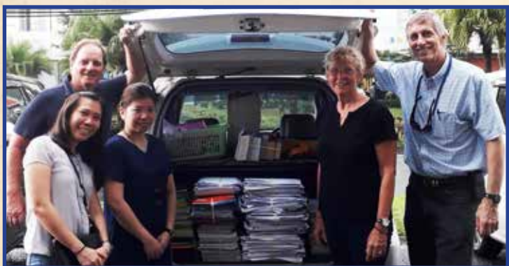
Mengambil buku-buku untuk disumbangkan kepada mereka yang membutuhkan