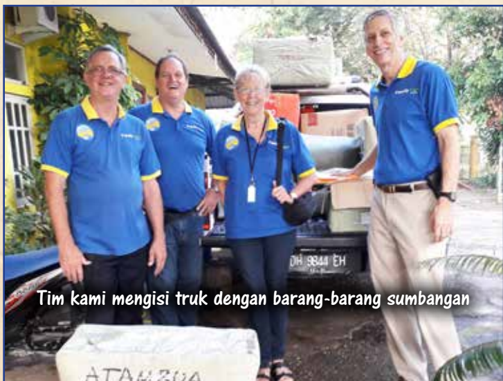
Tim kami mengisi truk dengan barang-barang sumbangan