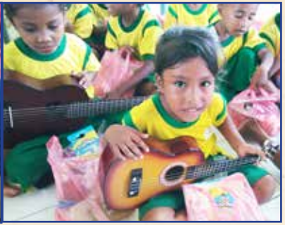
Anak-anak dengan alat-alat musik baru