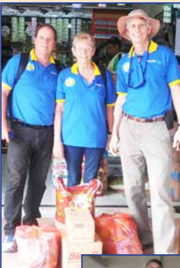
Tim relawan berbelanja barang-barang