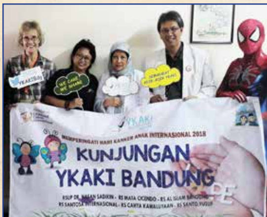
Bersama beberapa dokter dan Spiderman