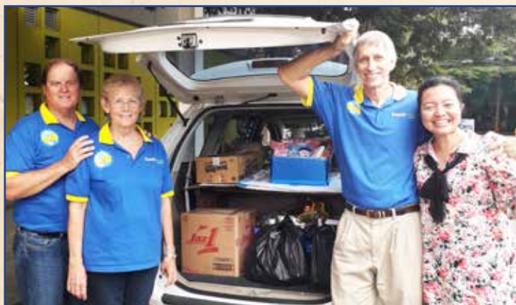
Tim kami dengan salah satu guru Binus dan barang sumbangan

Relawan bekerja bersama Binus Serpong mengumpulkan barang sumbangan untuk didistribusikan di tempat yang membutuhkan. Makanan dan perlengkapan kebersihan diantarkan ke YAI (tempat untuk anak-anak kanker) . Sedangkan perlengkapan sekolah akan diantarkan ke Sahabat Anak , organisasi yang memberikan Pendidikan untuk anak-anak jalanan.