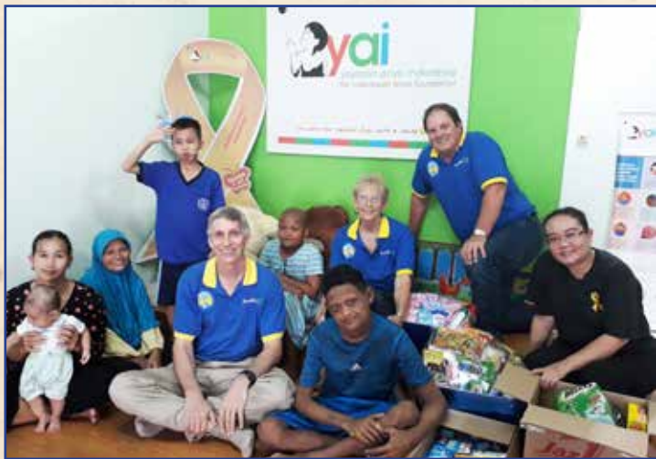
Bersama dengan semua anak-anak, orang tua dan para staff

Tim di Jakarta mengunjungi YAI ( Yayasan Anyo Indonesia ) mengantarkan barang sumbangan dan berinteraksi dengan anak-anak. Terima kasih kepada Sekolah Binus di Serpong yang telah menyumbangkan barang-barang ini.