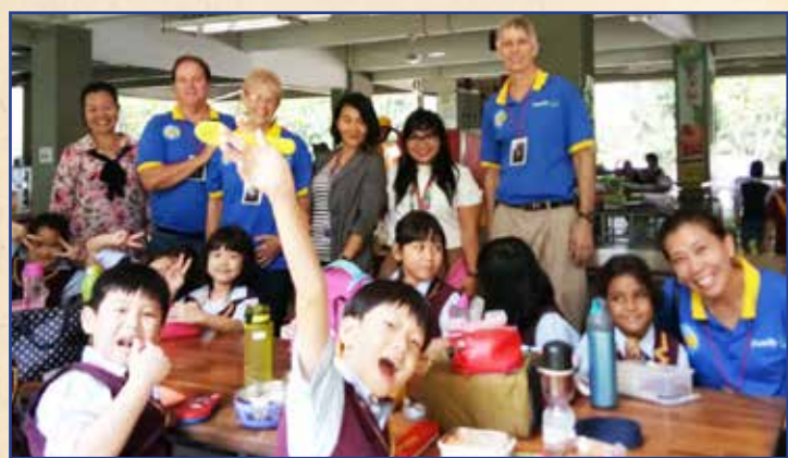
Menghabiskan waktu bersama anak-anak sekolah Binus selama waktu makan siang