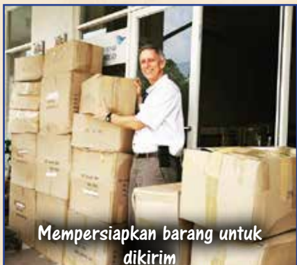
Mempersiapkan barang untuk dikirim

Kami mempersiapkan tim terdiri dari 4 orang ke Atambua, Nusa Tenggara Timor . Terima kasih kepada para sponsor sehingga kami bisa mengumpulkan lebih dari 400 kilo barang-barang. Barang sedang dalam perjalanan ekspedisi menuju Atambua.