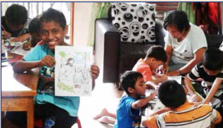
Anak-anak menikmati waktu beraktivitas bersama